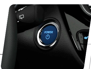
Encendido por botón (Smart Start)