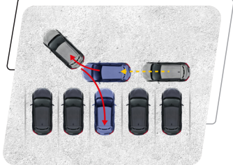
Asistente de Estacionamiento Inteligente (S-IPA)*