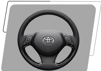
Timón de cuero, regulable en altura y en profundidad con controles de audio, teléfono y velocidad crucero