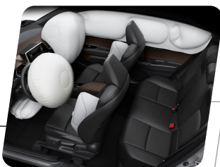
7 Airbags: Piloto + copiloto + laterales + cortina + rodillas (piloto)