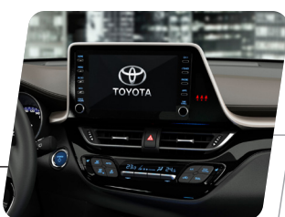
Pantalla táctil de 7" con funciones AM/FM, USB, Bluetooth, Apple Car Play, Android Auto